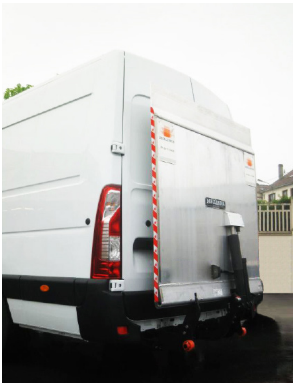
Hayon 500 kg DHLP avec plateforme de 1550 mm et arrêt de rolls