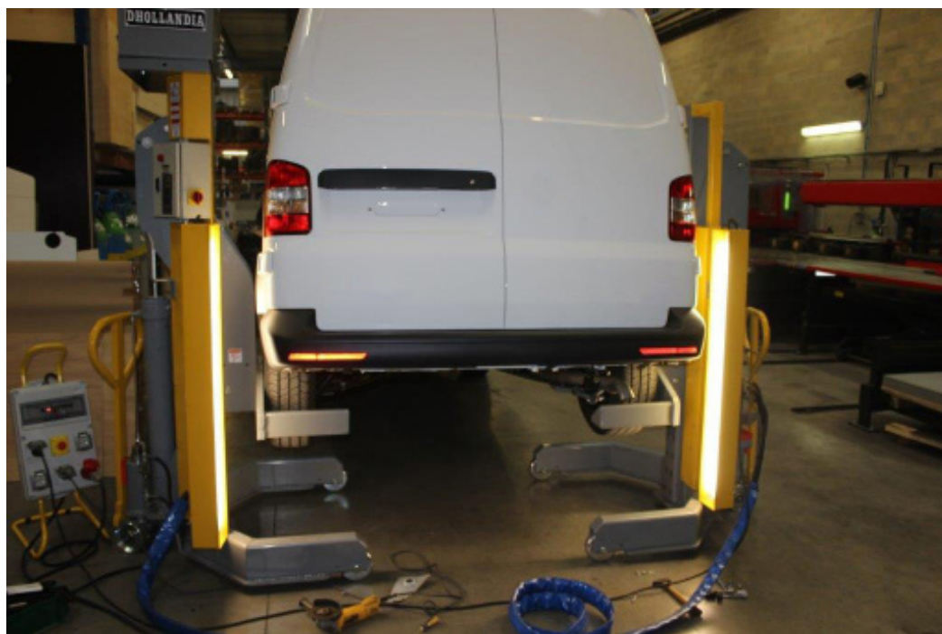
Zone dédiée et outillage spécifique destiné au montage des hayons éleveurs DHOLLANDIA.