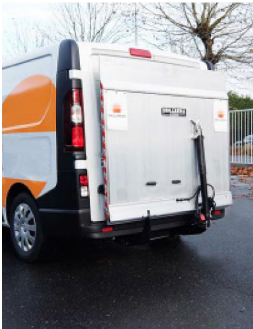
Hayon 500 kg DHLP avec plateforme de 1550 mm et arrêt de rolls